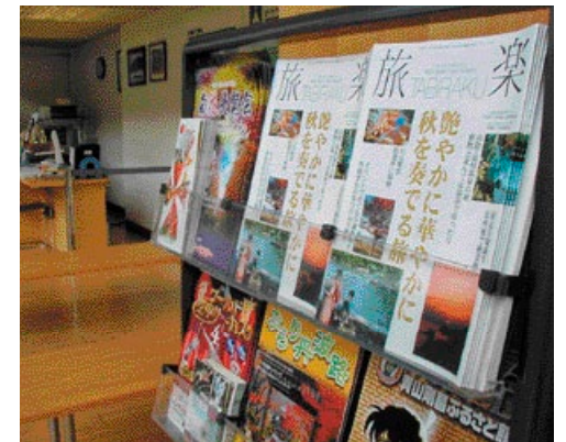
道の駅 フレッシュあさご