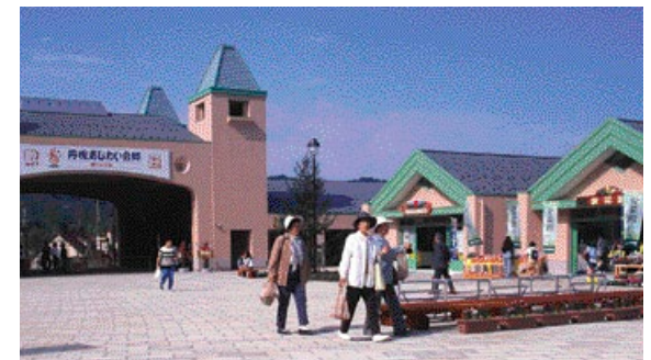
道の駅 丹後あじわいの郷